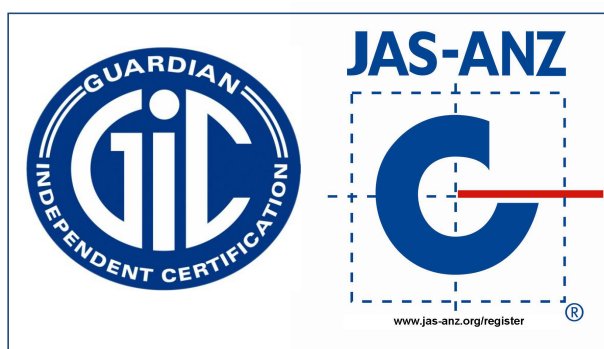
图 11 获得 JAS-ANZ 认可的 QMS 认证证书时，认可标志与认证标志的组合使用方法