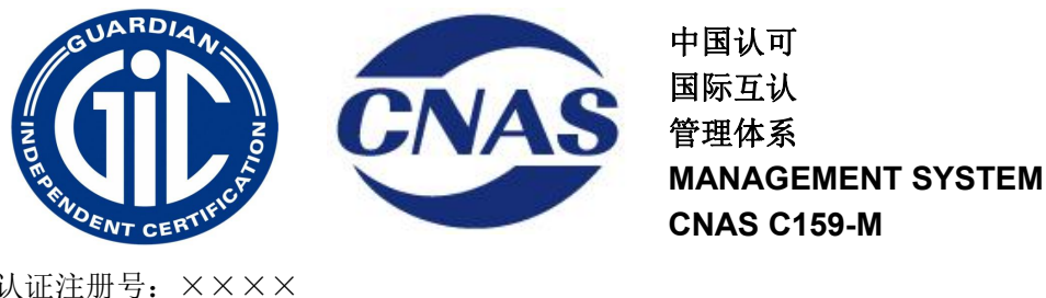
图 7 获得 CNAS 认可的 QMS\EMS 认证证书时, 认可标志与认证标志的组合使用方法

1) 获得 CNAS 认可标志认证证书时, 认可标志与认证标志的组合使用方法如下见图 7、图 8: